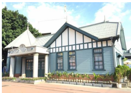
旗山車站-糖鐵故事館 https://cishanstation.khcc.gov.tw/