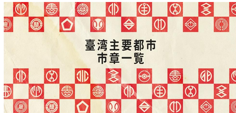
日治時期臺灣主要都市市章

「高雄一百」不僅是改制更名一百年，更是高雄成為現代化工業大城的發展歷程，也是臺灣移民城市的代表、臺灣民主運動的歷史縮影，更是高雄轉型改造的反省。透過 城市歷史探尋 ，鑑往知來，共同走向下一個百年。