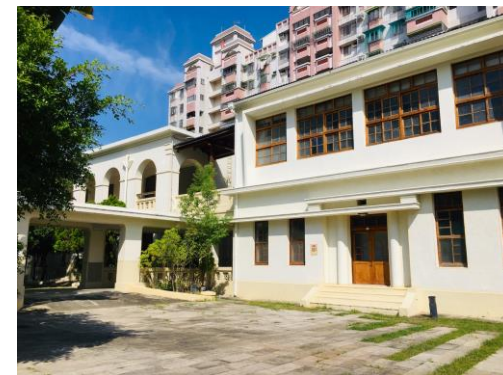
旗山生活文化園區 「市定古蹟舊鼓山國小」