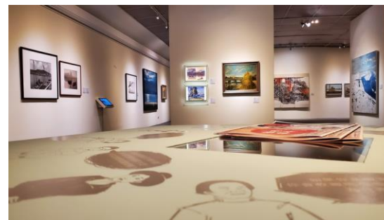
高雄市立美術館 (現館內展出「凝視與穿越—藝術典藏中的高雄百景」) https://trm.tw/