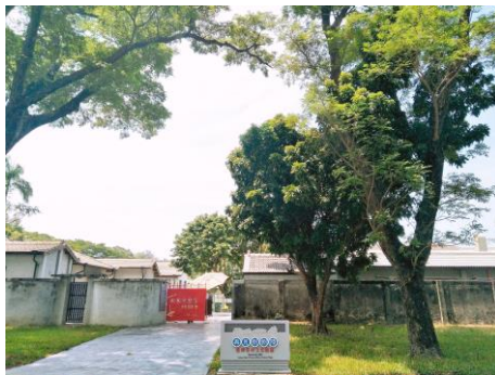
再見捌捌陸-臺灣眷村文化園區 https://www.facebook.com/Mingdexinchun/