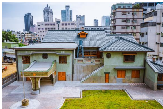
★逍遙園 (高雄一百活動期間新開園) https://www.facebook.com/xiaoyaotakao/