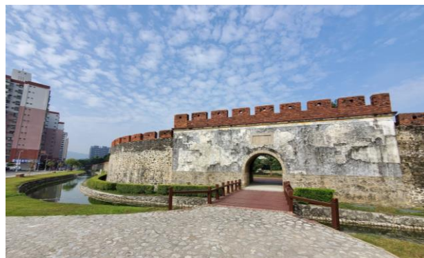
★左營舊城東門 (高雄一百活動期間護城河通水)