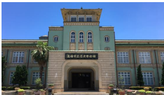
★高雄市立歷史博物館 (本身亦為古蹟·現館內展出大高雄歷史常設展) http://www.khm.org.tw/