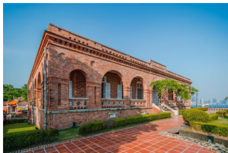
打狗英國領事館文化園區 (獲109年文化部國家文化資產保存獎) https://britishconsulate.khcc.gov.tw/